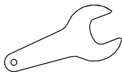
Chiave albero Shaft wrench